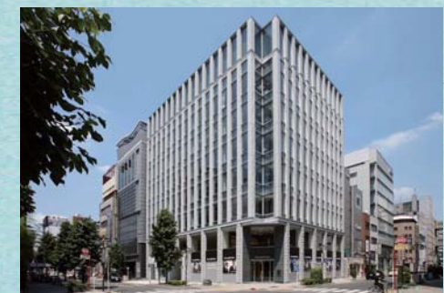
月曜日～金曜日（土・日・祝祭日・年末年始を除く）9:00～16:30は個人でご自由に6階閲覧・見学会に入室することができます。 ※団体の場合は要事前申し込み

このコーナーでは弊社とお付き合いのあるお客様の特色ある事業や魅力をご紹介します。今回は金融商品取引所として長い歴史を誇り、企業の上場サポート、投資家や証券アナリストに向けた情報発信を活発に展開している名古屋証券取引所さんです。