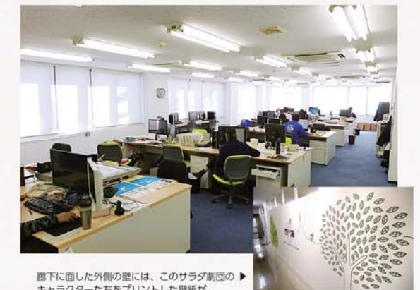
廊下に向した外側の壁には、このサラダ創団のキャラクターたちをプリントした壁紙が。

新入社員への導入研修として、また新規お取引の際の制作・製造現場の評価の場として、弊社では個別の会社見学会も開催しています。どうぞお気軽にご相談ください。