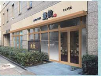
東京港区・魚屋の居酒屋 魚錠 芝大門店

会社概要 創業:1907(明治40)年 設立:1968(昭和44)年 本社所在地:犬山市大字五郎丸字隅田20番地3 URL: http://www.uojo.co.jp/