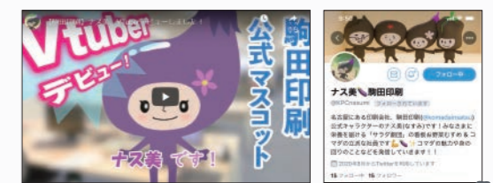
「駒田印刷ナス美ちゃんねる」