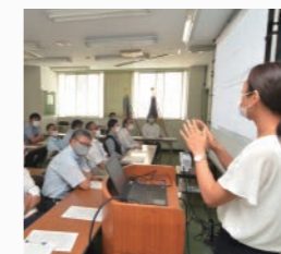
プレゼンテーション