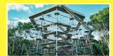
園内にある巨大クライミングアトラクション「万博BEAST」は料金やプレイ時間がお得にリニューアル

最近再び脚光を浴びる岡本太郎の「太陽の塔」や大阪万博に関する記念館「EXPO'70」のほか、日本庭園のつつじ、自然文化園のバラなど季節の花も楽しめます。園内はアスレチック、サイクルポート、パークゴルフ、バーベキュー施設や飲食店、温泉施設まで大充実。他にもガンバ大阪関連施設、大阪日本民芸館や国立民族学博物館と、スポーツ派もカルチャー派も存分に楽しめます。