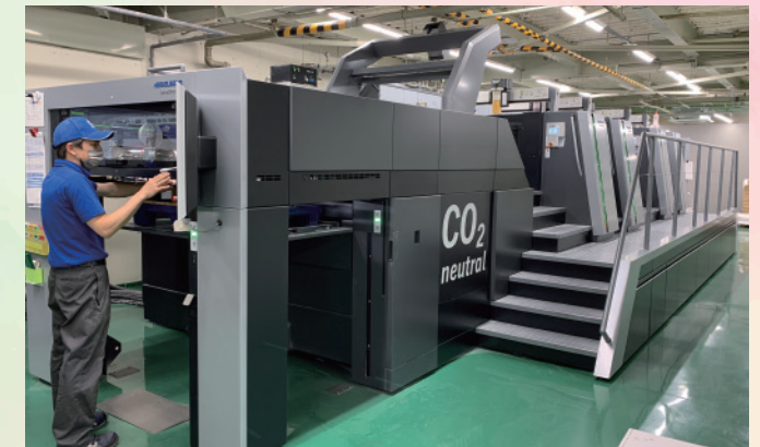
オペレーターの作業効率も格段に向上。高品質な製品を素早くお届けします。

今年度、SDGsの取り組みとして、これまでの活動に加え、新しく「CO 2 ニュートラル」を取得した印刷機を導入しました。この「CO 2 ニュートラル」は、印刷機械の生産工程において排出されたCO 2 の量を正確に計算し、その量に応じた金額をNGO法人に寄付することで、SDGsの17項目のうち11項目を満たします。当社では、お客様の製品の生産工程においても、SDGsに寄与するべく今後も積極的に取り組んでいきます。