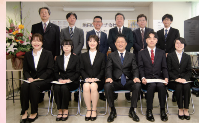
前列左から3名が営業、社長を挟んで右2名がデザイナーとして配属予定です!

今年の営業は久しぶりに全員女性。そしてデザイナーは一度に2名採用という、こちらも久しぶりという結果になりました。全員一丸となって、共に新時代を切り拓いていきますので、どうぞよろしくお願いいたします!